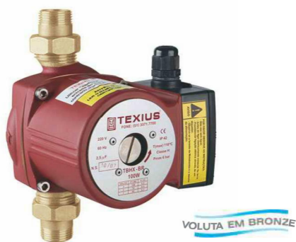
TBHX-BR • 100W