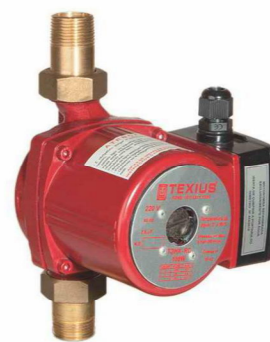
TBHX-RC • 100W